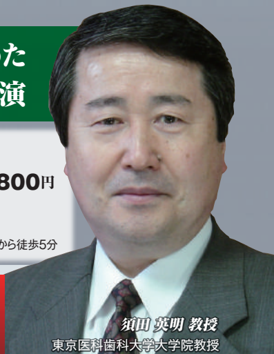
須田英明 教授 東京医科歯科大学大学院教授